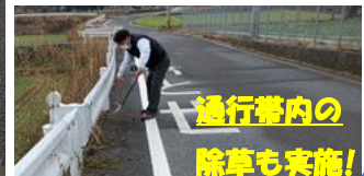
通行帯内の除草も実施!

宇佐高校への通学路で道路が狭く、危険な為自転車通行帯路面標示(650m)を実施して頂きました。土木課の迅速な対応有難う御座いました。