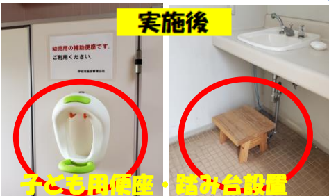
子ども用便座・踏み台設置

宇佐市総合グラウンド横(古代ふれあい広場)にあるトイレで「便座や手洗い場で園児が使いにくい」と保育園の先生から相談があり、市にお願いし設置しました。