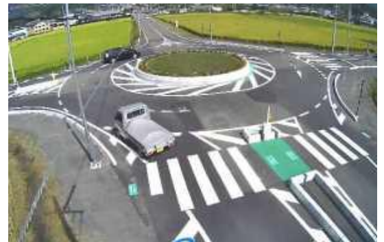
(・国土交通省 HP の資料より引用)