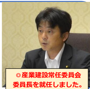
◎産業建設常任委員会 委員長を就任しました。